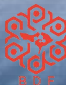
AA I A Maharani Direktur